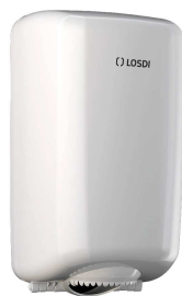
REF: CP-0528-B Acabado BLANCO