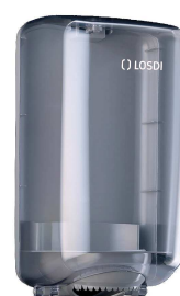
REF: CP-0528 Acabado FUMÉ