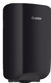
REF: CP-0528-C-BL Acabado NEGRO